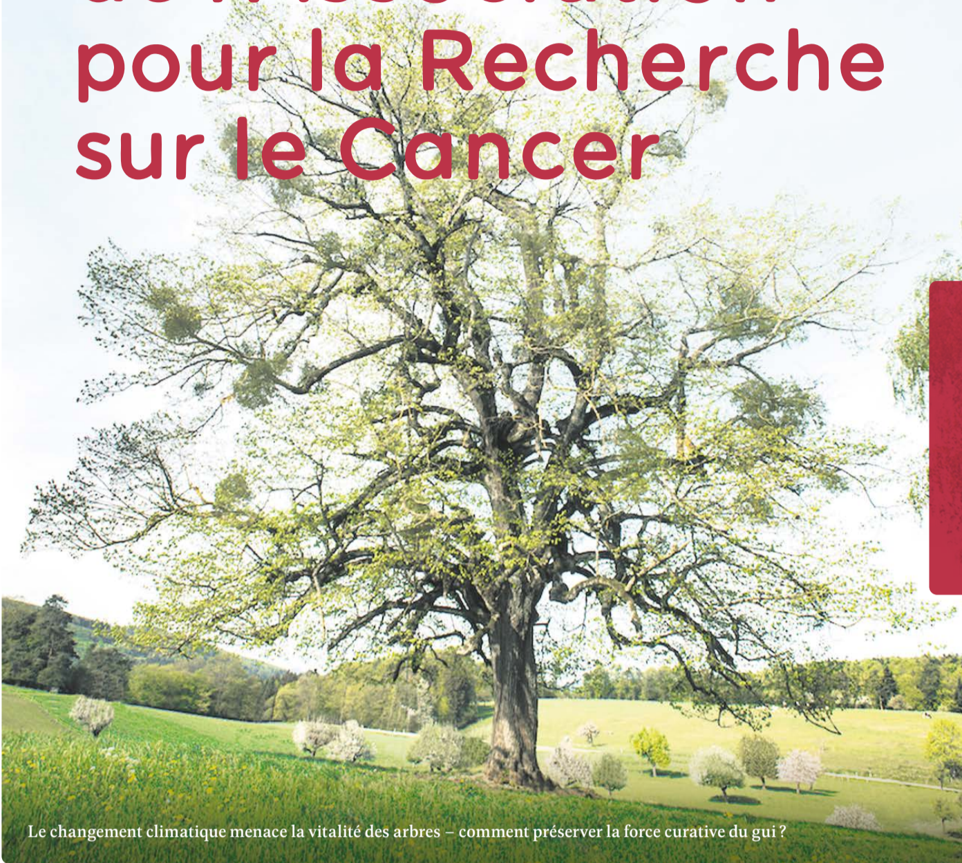
Le changement climatique menace la vitalité des arbres – comment préserver la force curative du gui ?

L'Association pour la recherche sur le cancer fait partie des rares institutions encore indépendantes qui se consacrent à la recherche dans le domaine de la médecine complémentaire. Cela vaut particulièrement pour le développement de nouvelles préparations pour le cancer à base de plantes médicinales et autres substances naturelles. Leur introduction dans la médecine oncologique intégrative nécessite des études cliniques – une autre compétence de l'association.