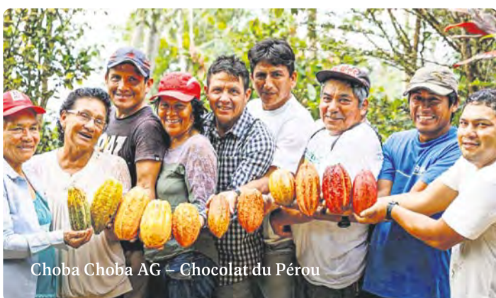
Choba Choba AG – Chocolat du Pérou

Au moment d'accorder un crédit, la Freie Gemeinschaftsbank ne tient pas seulement compte du calcul financier, mais aussi de la personnalité des porteurs de projet : y a-t-il une vision ou bien s'agit-il exclusivement de taux de rendement ? Peuvent-ils enracciner leur idée et la porter ensuite ? Ont-ils un entourage qui soutient leur initiative ? La banque offre la possibilité de garantir un prêt par des « petites cautions solidaires », en l'absence d'autres garanties : les porteurs de projet peuvent chercher dans leur entourage des citoyens qui apportent chacun une caution privée de 2000 francs à l'emprunt nécessaire.