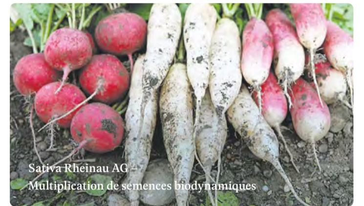
Sativa Rheinau AG – Multiplication de semences biodynamiques

Dans ces prêts fiduciaires, les investisseurs ont la possibilité de percevoir consciemment la perspective de l'emprunteur et de prendre des décisions en toute responsabilité, en tenant compte de l'autre partie. Ce point est particulièrement net dans le cas du choix du taux d'intérêt : au sein d'un cadre prédéterminé, les investisseurs par prêts fiduciaires peuvent décider du montant des intérêts. S'il est élevé, le projet nécessitera plus d'efforts pour couvrir les charges, s'il est moins élevé, le projet dispose de plus d'espace financier. Les investisseurs soupèsent la question et décident en ayant conscience de leurs propres besoins et de ceux de l'autre.