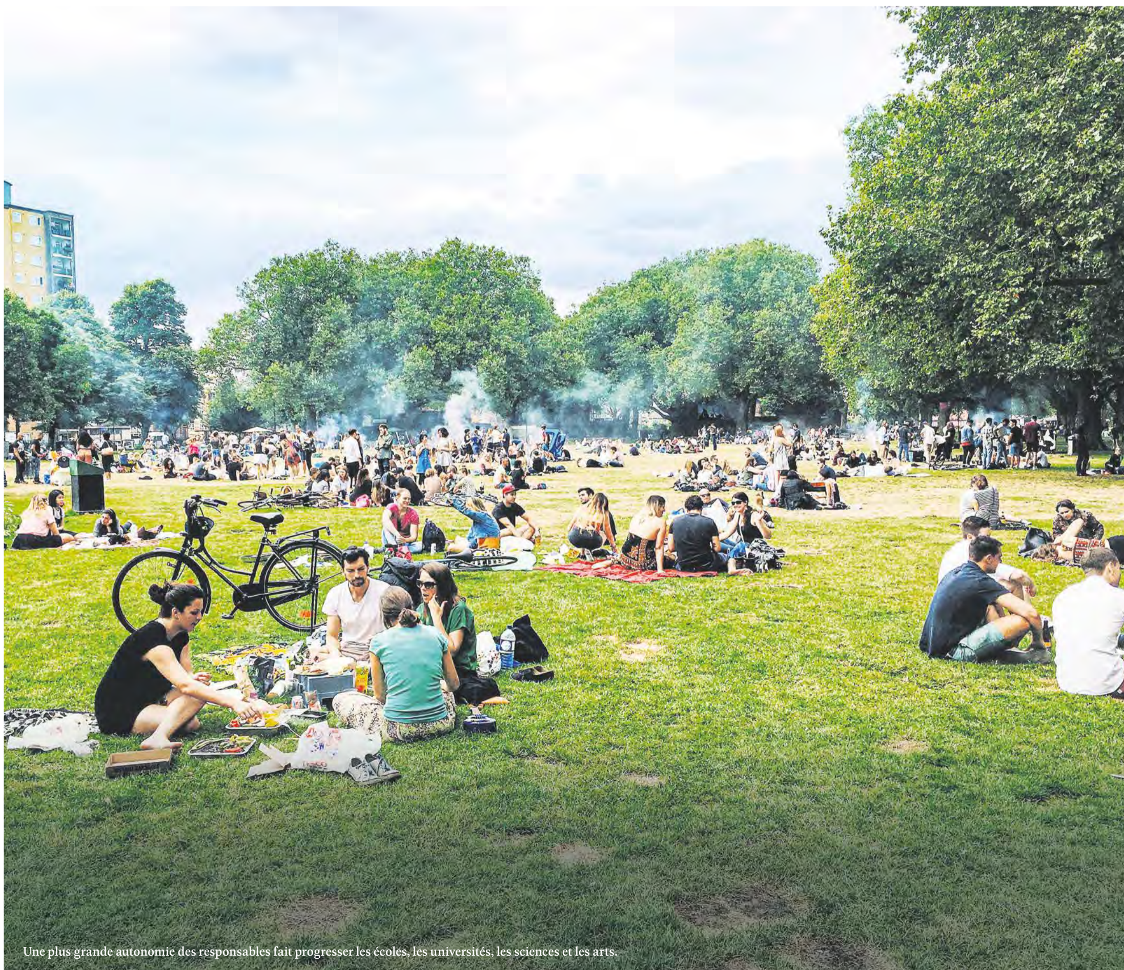
Une plus grande autonomie des responsables fait progresser les écoles, les universités, les sciences et les arts.

« Désétatiser la gestion de la vie individuelle et de l'approvisionnement économique. »