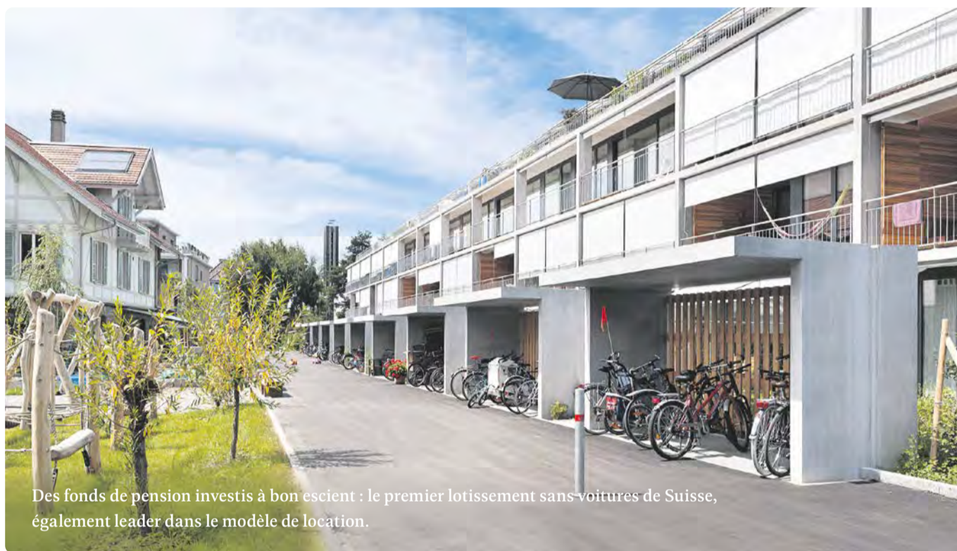
Des fonds de pension investis à bon escient : le premier lotissement sans voitures de Suisse, également leader dans le modèle de location.

En 1985 est entrée en vigueur la LPP, deuxième pilier de l'assurance vieillesse, avec un financement par capitalisation. Ainsi, les biens des caisses de retraite s'accumulent-ils, ils sont placés dans l'immobilier, en actions et obligations et se trouvent de ce fait retirés de l'économie réelle. L'exemple de la CoOpera montre que l'on peut procéder autrement et quelles possibilités s'offrent alors à la communauté.