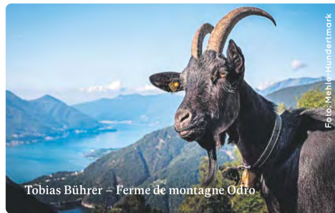
Tobias Bührer – Ferme de montagne Odro

La coopérative n'est pas seulement porteuse de la banque, mais aussi espace de résonance pour des idées : au cours des dernières années, la possibilité de nouveaux pas dans le développement de la banque a été évoquée avec des coopérateurs intéressés, leurs avis ont été intégrés dans le processus de concrétisation des idées.